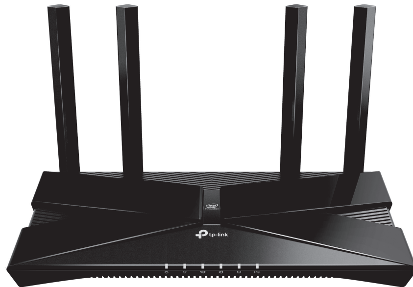
AX3000 ギガビット Wi-Fi 6 ルーター